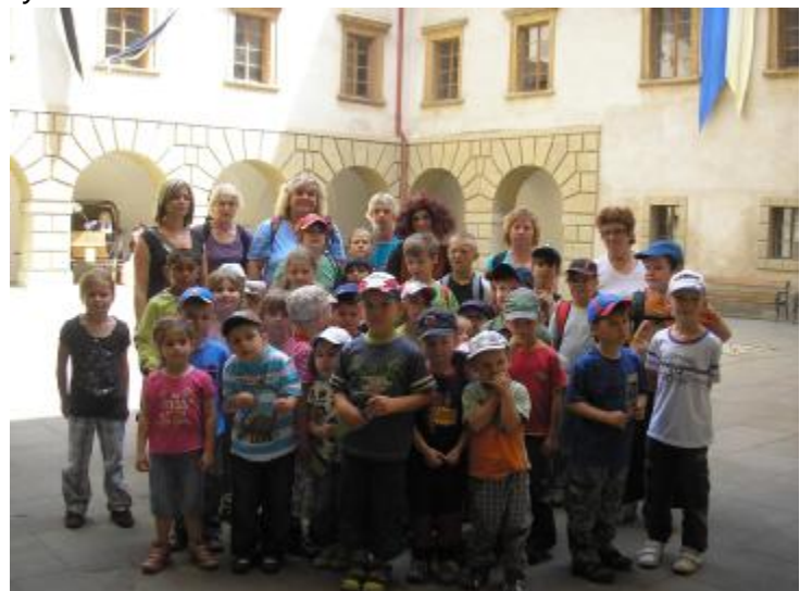
Foto z výletu MŠ a ZŠ Jetřichov do Starých Hradů u Jičína