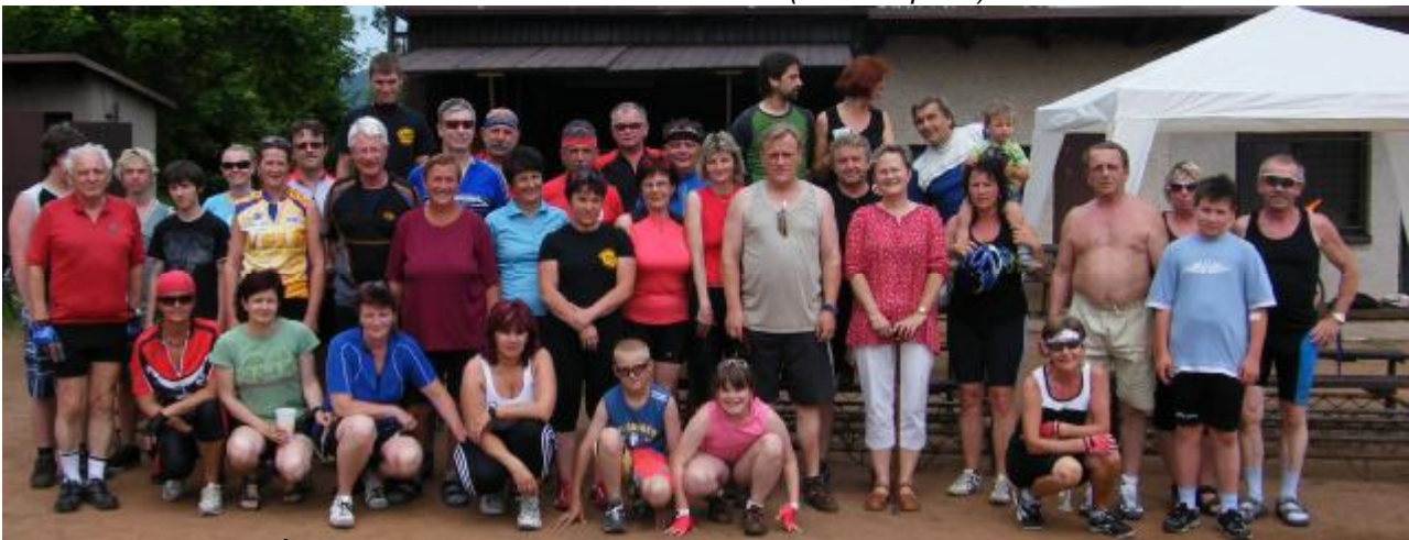
Účastníci šestého ročníku Cyklistického memoriálu Jiřiho Němečka