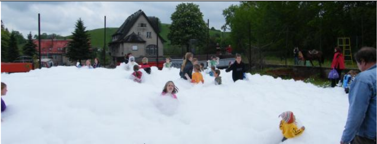
DĚTSKÝ DEN – 30.5.2010 (řádění v pění)